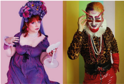
© Fräulein Bürgerschreck / Drag King Eric