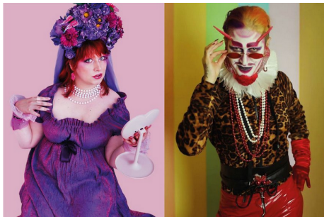
© Fräulein Bürgerschreck / Drag King Eric